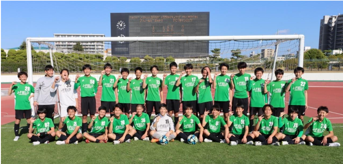
高円宮杯 JFA 第35回全日本U-15サッカー選手権中国地域大会 - トーナメント